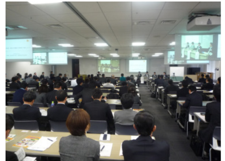
これまでのセミナーの様子